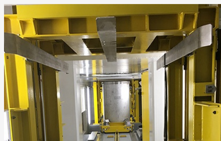
ORANO LA HAGUE - Chaîne transitive et de remplissage Silo 130