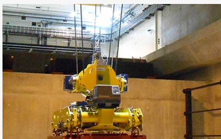
EDF - Process manutention-convoyage sécurisé pour ICEDA