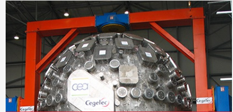
CEA Cesta : Projet Laser Mégajoule (LMJ) - Sphère d'expérience, équipements de montage et de maintenance