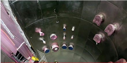
CEA Cadarache : Réacteur Jules Horowitz (RJH) Piscines nucléaires et leurs équipements associés