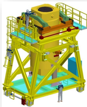
ICEDA – Spent level cask transfer machine