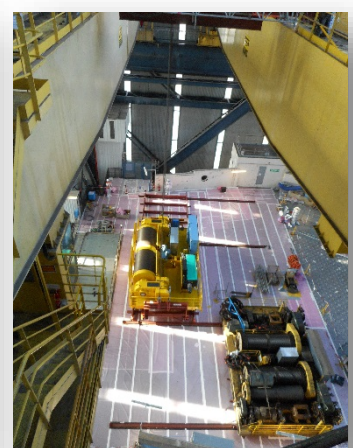
EDF Bugey 1 NPP – refurbishment of the cranes