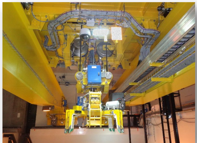
ICEDA: Interim Storage for ML and LL wastes Remote operated cranes