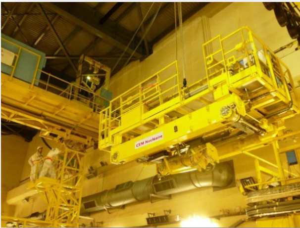
EDF NPPs: 20 tons safety cranes in nuclear pool building